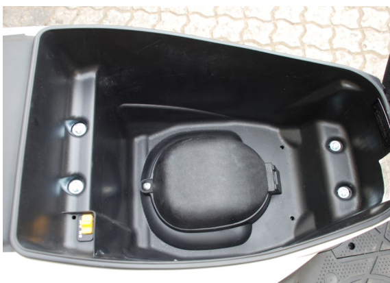
Stor opbevaringsrum under sæde