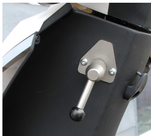
Gearskifte håndtag til bak- gear