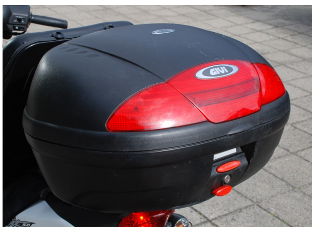
Stor aflåselig boks med god opbe- varingsplads fås som tilbehør i 2 str.