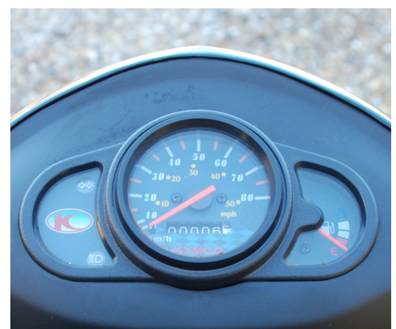
Stor og overskuelig instrument- panel