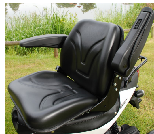
Sæde med armlæn fås som tilbehør.