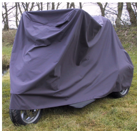
Vind- og vandtæt garage i 2 modeller.