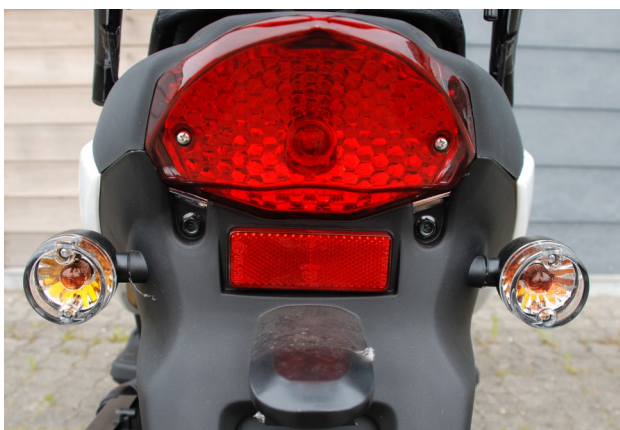
Meget tydelige bag- og blinklys