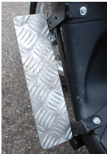
Benstøtteholder for stift ben

Gratis demonstration af knallert, hjemme hos dig. Personlig vejledning 100% service