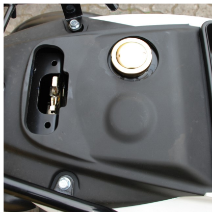
Påfyldning af benzin - tank under aflåselig sæde